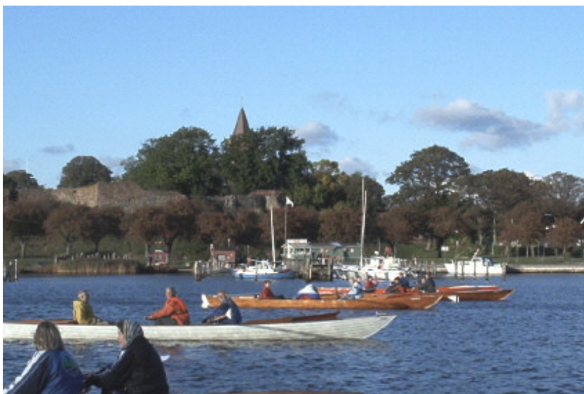
Starten i 2'årsers inrigger 19.10.2002

Husk vores: Klubkaproning d. 20.oktober 2007 Start kl. 13.30